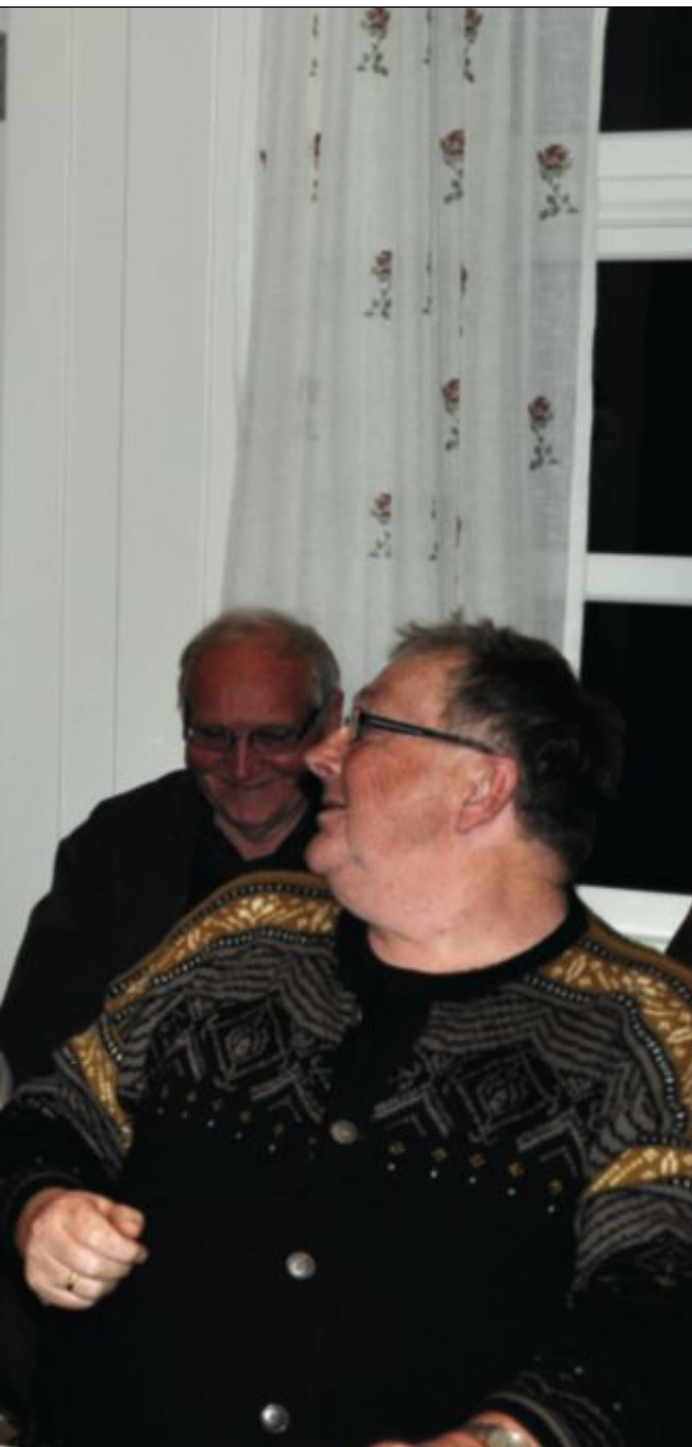
professoren for innsatsen.