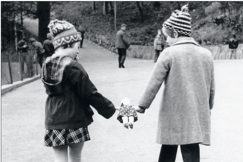
UHØYRDE STEMMER: Onsdag opnar den nasjonale utstillinga "Uhørte stemmer og glemte steder" på Vestnorsk utvandringscenter på Sletta. Utstillinga får fram stemmene til menneske som aldri før har hatt nokon sentral plass i norsk offentlegheit.