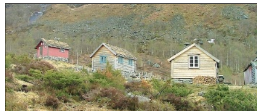
STØLSTUR: Nordhordland Turlag inviterer på stølstur til Eksingedalen – med smak av kortreist mat.

I 1992, då hendinga føregår, hadde bygda postkontor, BNR-bussane kjørte gamlevegen der folk budde og mobiltelefonane var store som mursteinar. Det er premiere lørdag 8.september, og framsyningar både 9.-, 13. og 14.september.