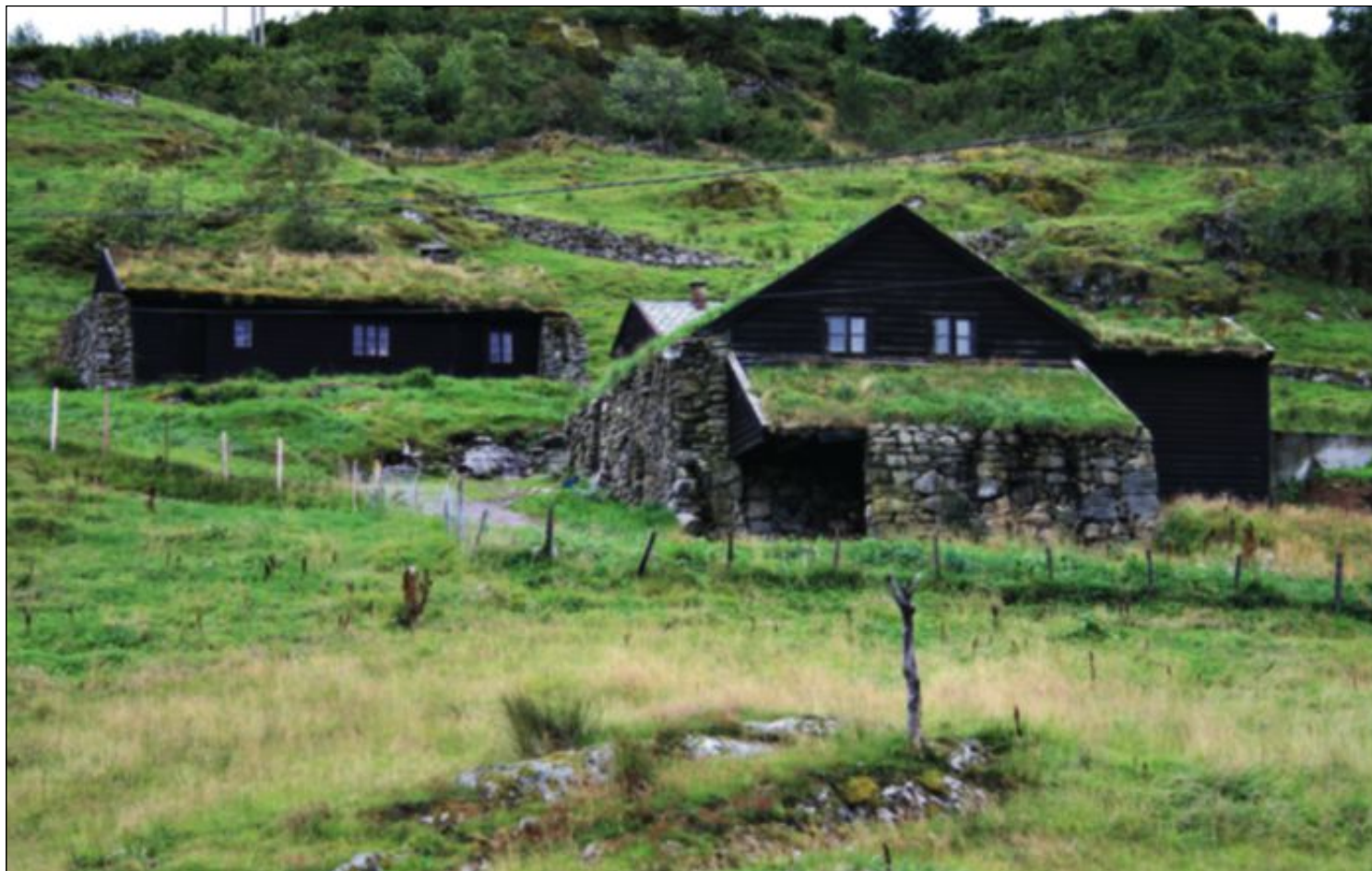
FRÅ NOREG TIL AMERIKA: Garden Åsen på Øvre Tveiten, Radøy, representerer det mange nordmenn reiste frå rundt 1900. Besøk der høyrer med når Radøy søndag markerer oppstarten av Kystsogevekene med arrangementet «Frå Noreg til Amerika».