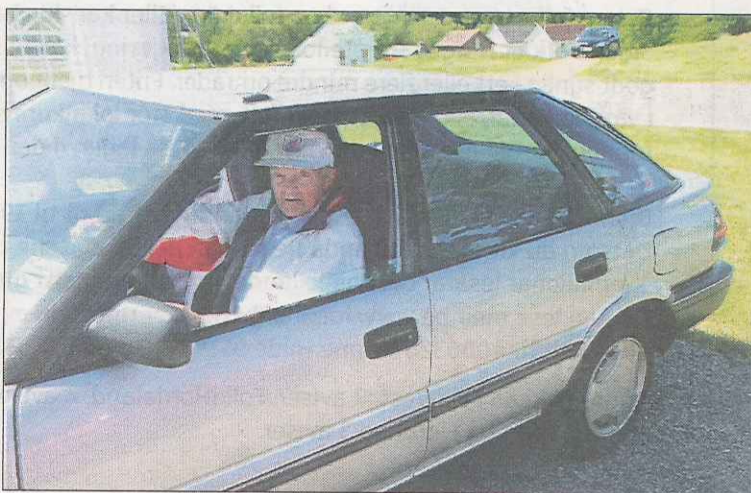
SPREK: Ikkje kvar dag ein ser ein 97-åring køyra sin eigen bil.

– Gjenstandar får ei heilt anna betydning når ein har ei personleg historie å knytta dei opp til, avsluttar ho.