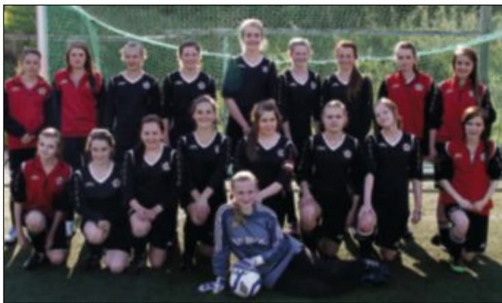
BRONSE: Radøy/Manger sine jenter 98 tok ein fin tredjeplass.

Jentelag både frå NBK og Radøy/Manger gjorde ein sterk innsats i Lerum Cup.