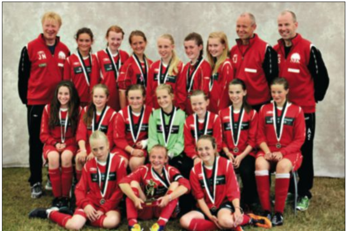
SØLV: NBK sine 99-jenter kneip andreplassen i årets Lerum Cup i Sogndal.

I sluttspillet søndag vart det 1-1 i semifinalen mot Lyngbø, og NBK gjekk vidare med fleire hjørnespark. I finalen møtte ein