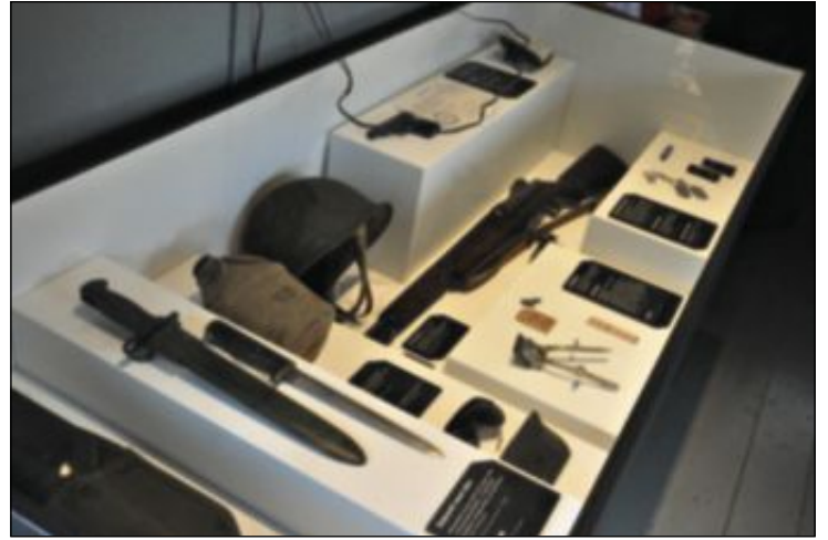
LITT AV UTSTYRET: I ein monter kan ein sjå nærmare på våpen og andre ting som stammar frå Bataljon 99.