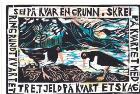
MIGRANTAR MED FJØR: Utstillinga «Fugleåret: Folketro og fakta» - tresnitt av Amy Lightfoot, i emigrantlandsbyen i april. Biolog Nils Rov held foredrag om «Migrantar med fjør».