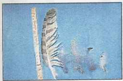
HUBROFJØR: Den store fjøra er 27 cm lang.