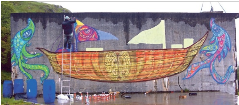
HØGDEBASSET PÅ SÆBØ: Båten symboliserer strilane og utferda til Amerika, og sjøfisket som ein av hovudnæringsvegane i gamle dagar.