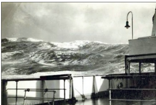
HARD SJØ: Overfarten kunne vera krevjande.

Amerika. Ikkje alle gjekk det like godt med. Mange sende nok heim «skrytebilde» som ikkje fortalde heile sanninga. Det kunne vera han som tok bilde av seg med Sheriff-stjerna på brystet, og revolver i handa. Han arbeidde nok som vaktmann. Eller ho som tok bilde av seg i moteriktig hatt sitjande i ein luksusbil. Ho var tenestejente hjå Rockefeller.