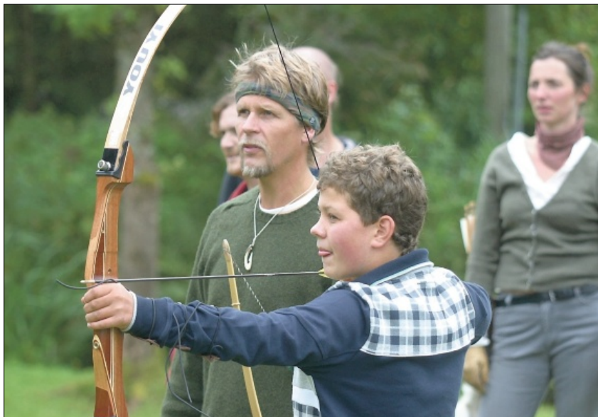
Bildet er frå eit tidlegare kurs i bogeskyting.

utvandrarfestival. Det er eit fint høve til å vitja utstillinga.