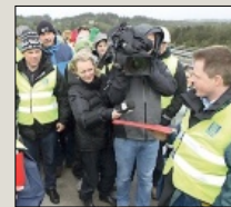
Frå synfaring i traséen nyleg.