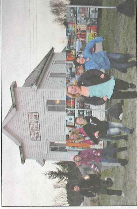
UTE: Ufor rådhuset på Sletta står fotoutstillinga «Minner fra migrasjon». Sjuandeklassen på Austebygd skule deltok og på opninga.

Utstillinga er i det gamle rådhuset på Sletta. Utanfor står fotoutstillinga «Minner fra migrasjon», som er laga i Oslo. Den viser glimt frå dagleglivet i det fleirkulturelle Noreg.