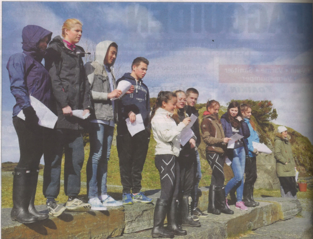
ROLLESPEL: Ungdommane fekk gå inn i roller for å kjenna litt på korleis det var å leva for to hundre år sidan. Her gjekk det i tøffe forhandlingar mellom bønder og kjøpmenn om kornprisen, basert på verkelege hendingar i Bergen i 1814.