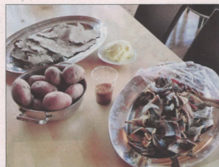
EINSFORMIG: Flatbrød av tang- og barkmjøl, heimekinna smør og graut var kvardagskost på 1800-talet. Poteta var på veg inn, og salta nubbesild var den tidas godteri.