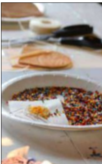
PERLEFINT: Dei som ville, kunne laga seg ei lita skinnveske med perlepynt.

Vestnorsk utvandringssenter baud på tidsreise «Frå vikingland til Amerika» i helga, i samarbeid med Viking- og mellomalderdagane på Lygra. Dei som kom til Sletta, kunne boltra seg med mange utstillingar. Sy indianarveske med perlepynt, sjå flintknakking, prøva gullgraving, og pil- og bogeskyting, i tillegg til at det var liv i alle emigranthusa. I Emigrantkyrkja var det konsert, og om ein ville til vikingtida, var det berre til å ta seg ein tur med D/S Oster, som skyssa folk mellom Sletta og Lygra.