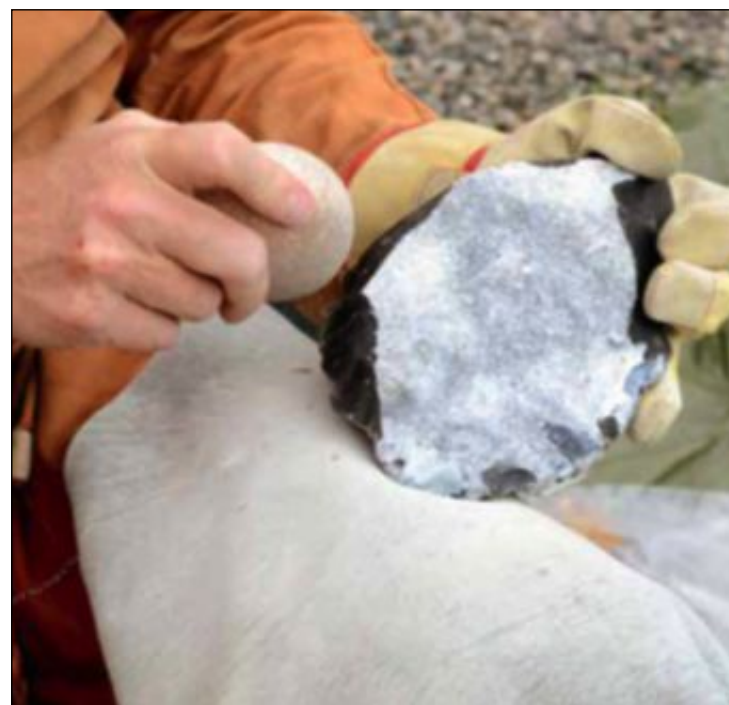
STEIN OG GEVIR: Kutschera brukar slagreiskap som folk i steinalderen hadde tilgang på. Steinen brukar han til grovhogging og opprydding av kantane rundt emnet.