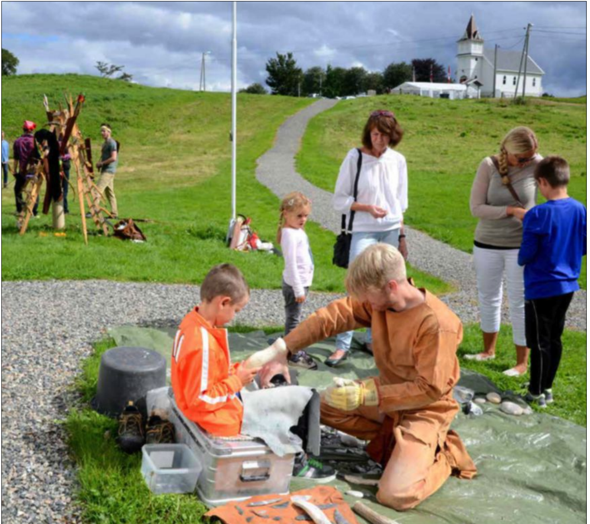
VIKINGLAND OG AMERIKA: Vestnorsk Utvandringssenter samarbeidde med Nordhordland Frie Vikingar og Lyngheiseretret på Lygra for å skapa samanheng mellom emigrantliv og vikingtid i helga.