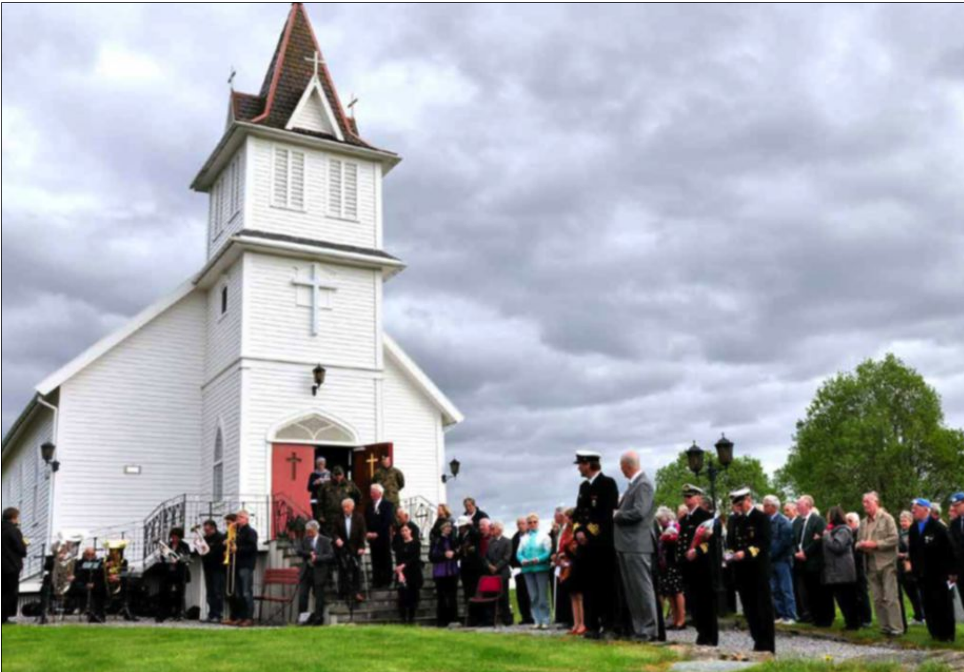
FLOTT 8. MAI-KULISSE: Med sine minnebautaer både for 99th Batallion og krigsseglarane, var Emigrantkyrkja og utvandrarsenteret ei flott kulisse for årets 8. mai-markering.