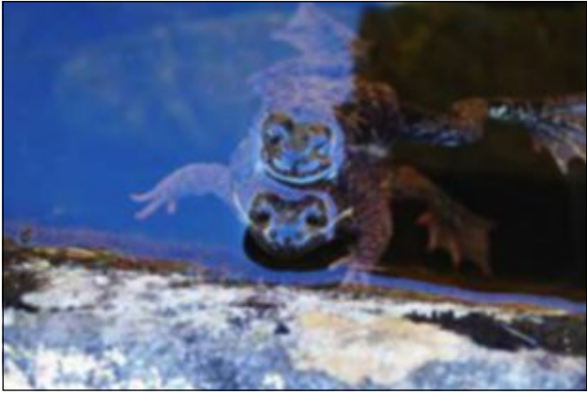
FROSKE-ELSKOV: Fotojakt i påska gav mellom anna dette blinkskotet av to froskar som har vakna etter vinterdvalen og teke til med meir vårlege aktivitetar. Me håpar på godt og talrikt resultat.