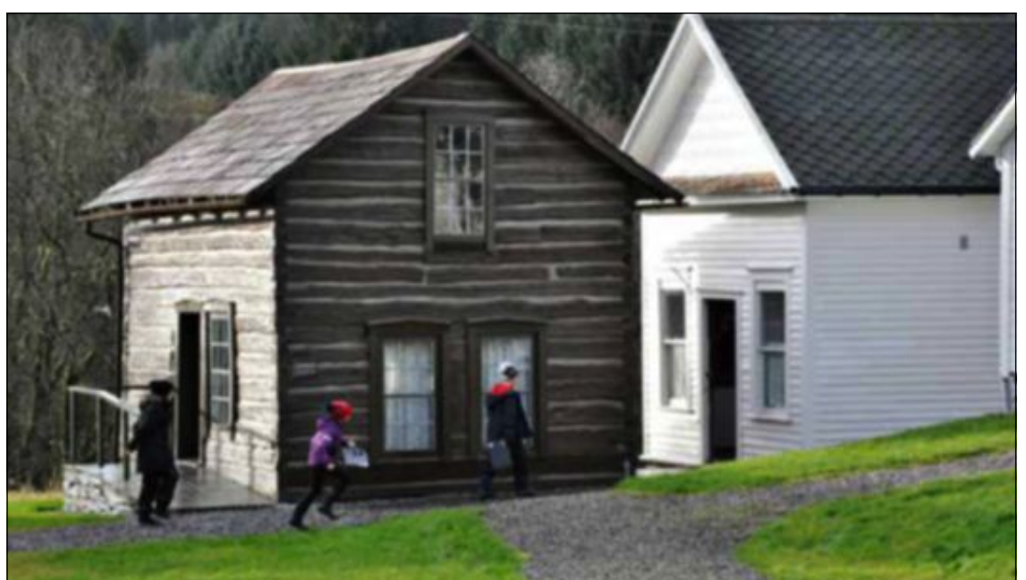
FULL FART: Elevane sprang frå hus til hus for å leita opp svar til rebusen.

matpause der me leika «Bom 25». Det er mykje kjekkare å vera her enn på skulen, slår jentene fast før dei hastar vidare til nye oppgåver.