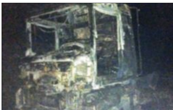
FORFERDELEG SCENARIO: Det utbrente vraket av lastebilen som mandag forårsaka brannen i Gudvangtunnelen, fotografert av brannsjef Arvid Gilje i Aurland brannvesen. Tunnelen har fått store skader, og enno ligg folk på sjukehus etter brannen, som heldigvis ikkje tok menneskeliv.

Fire av tunnelane på strekket er over 1,5 kilometer lange. Dei to